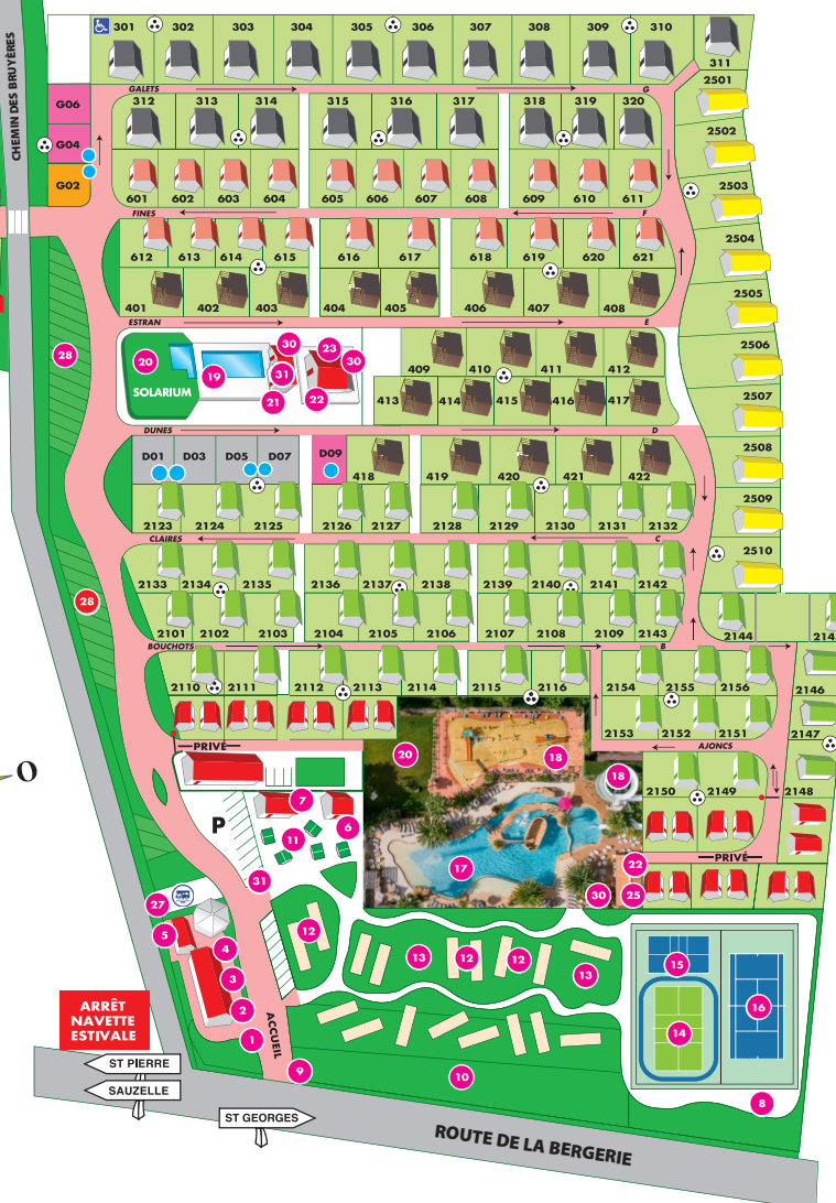
Partie « GRAND CONFORT »