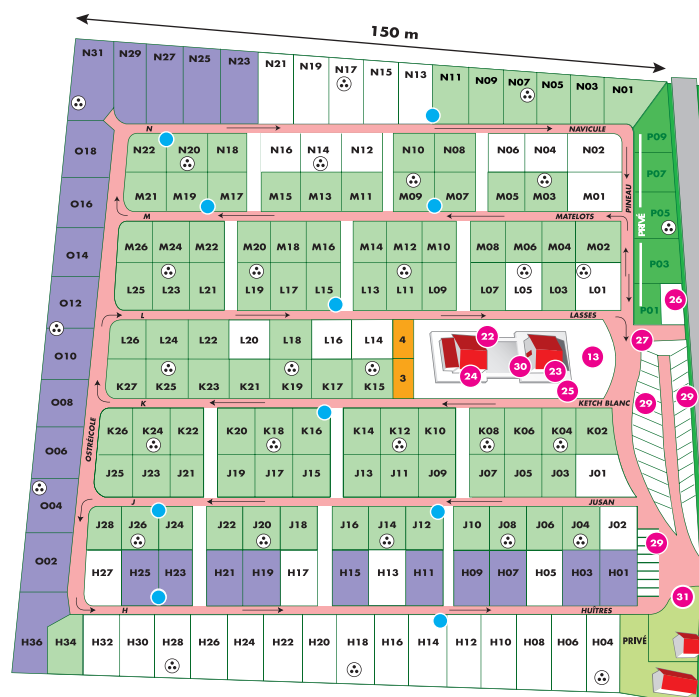
Partie « TOURISME »