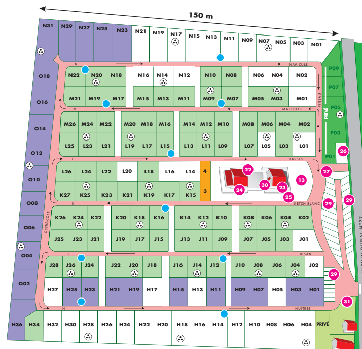
Partie « TOURISME »